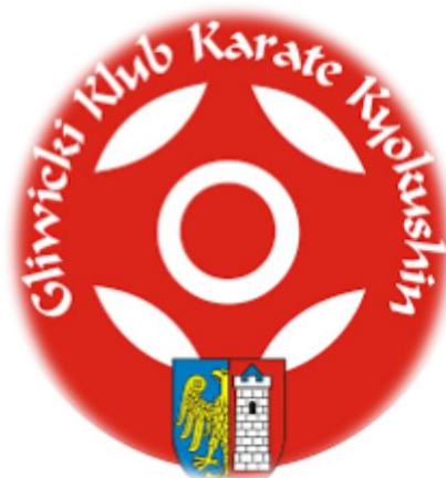
Logo Gliwickiego Klubu Karate Kyokushin