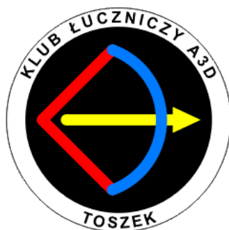
Logo Klubu Łuczniczego A3D Toszek