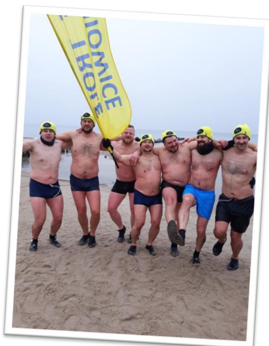
Członkowie Klubu Morsów „Zimne Trole” po morsowaniu