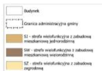
Mapa 1 – Tereny rozmieszczenia stref planistycznych SW, SJ i SZ w granicach administracyjnych gminy Toszek

Otrzymane dane zestawiono z terenami niezabudowanymi w strefach, o których mowa w art. 13c ust. 2 pkt 1–3 ustawy.